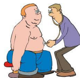
سابقه فامیلی Family history